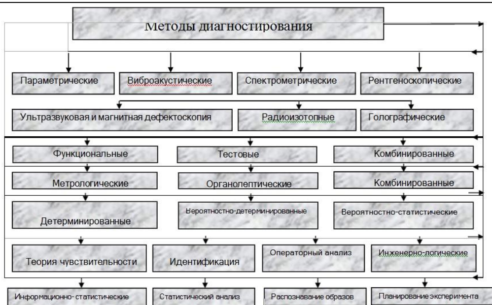
Рис 2. Выбор методов диагностирования

ПК-6.1 Принимает управленческие решения на основе интеллектуального анализа показаний средств диагностики локомотивов, с использованием современных цифровых технологий