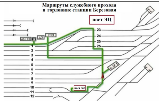
Рис.1 Маршруты служебного прохода для передвижения работников в южной горловине станции

Сигналист, в виду свободы путей от подвижного состава по 7С, 8С и 9С пути, устремилась к стоящему по 5С пути поезду №3003 по кратчайшему пути, игнорируя служебные проходы, смотри Рис.2 (нарушение условий передвижения по ж.д. путям работника станции к месту работ). Произвела закрепление поезда №3003 с юга двумя тормозными башмаками №345 и №344, после чего, устремилась обратным путем к посту №3 (повторное нарушение условий передвижения по ж.д. путям работника станции).