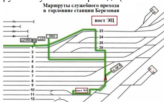
Рис.1 Маршруты служебного прохода для передвижения работников в южной горловине станции

Передвижение работников ж.д. транспорта по станции Березовая в южной горловине, должно осуществляется согласно маршрутам служебного прохода (выписка из ТРА), смотри Рис.1.