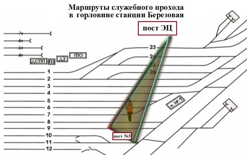
Рис.3 Визуальный контроль во время работы маневрового диспетчера