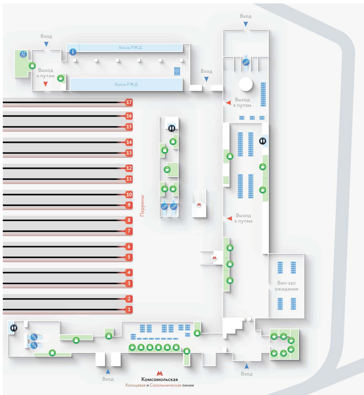
Рисунок 1.1 – Схема Казанского вокзала

Для заданного вокзального комплекса разрабатывается ряд мероприятий и выбирается маршрут беспрепятственного следования маломобильного пассажира согласно СТО РЖД 03.001-2014.