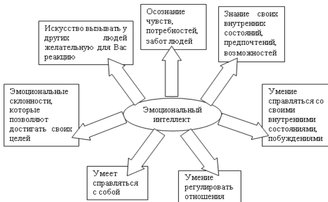
Рис. 1 Структура эмоциональной компетентности

На рисунке.1. представлено содержание эмоциональной компетентности (Д. Гоулман). Заполнить пустые элементы данного рисунка (стрелки), написав название 7-ми компетенций.