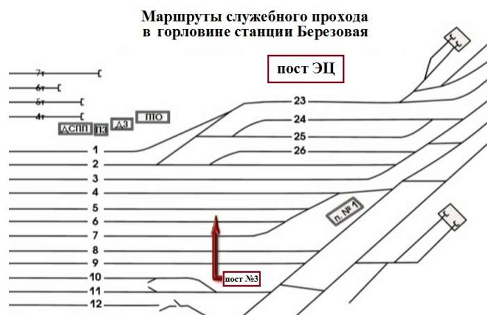
Рис.2 Маршрут передвижения сигнальщика Виноградовой А.П. в южной горловине станции

Сигнальщик, в виду свободности путей от подвижного состава по 7С, 8С и 9С пути, устремилась к стоящему по 5С пути поезду №3003 по кратчайшему пути, игнорируя служебные проходы, смотри Рис.2 ( нарушение условий передвижения по ж.д. путям работника станции к месту работ ). Произвела закрепление поезда №3003 с юга двумя тормозными башмаками №345 и №344, после чего, устремилась обратным путем к посту №3 ( повторное нарушение условий передвижения по ж.д. путям работника станции ).