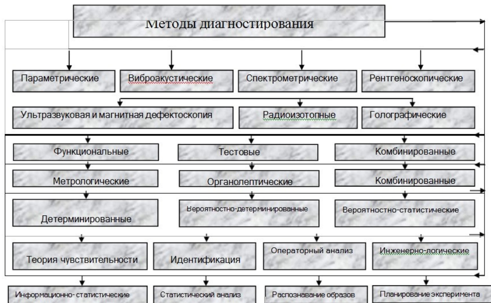
Рис 2. Выбор методов диагностирования

ПК-6.1 Принимает управленческие решения на основе интеллектуального анализа показаний средств диагностики локомотивов, с использованием современных цифровых технологий