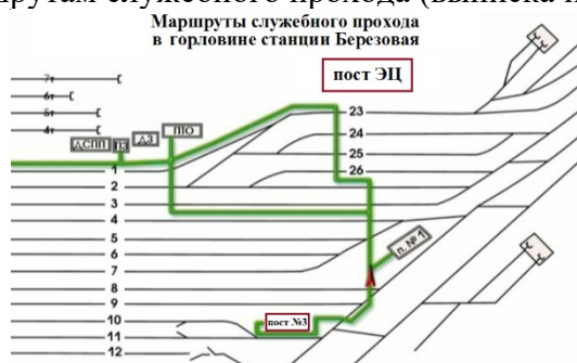
Рис.1 Маршруты служебного прохода для передвижения работников в южной горловине станции

Передвижение работников ж.д. транспорта по станции Березовая в южной горловине, должно осуществляется согласно маршрутам служебного прохода (выписка из ТРА), смотри Рис.1.