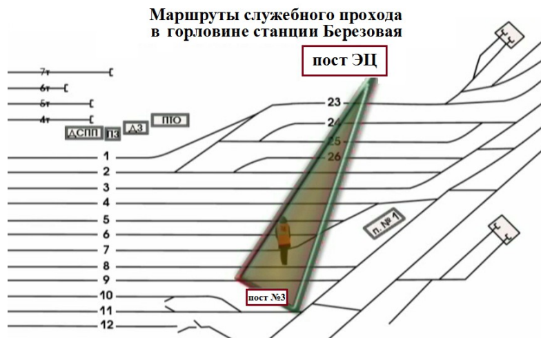
Рис.3 Визуальный контроль во время работы маневрового диспетчера