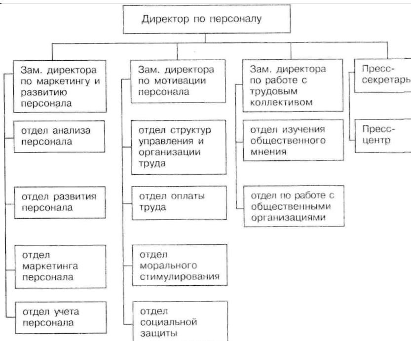
Рис. 4.1. Схема организационной структуры дирекции по персоналу

Рассмотрим кратко эти основные направления.