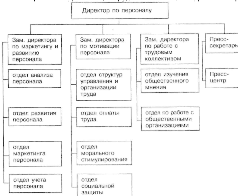
Рис. 4.1. Схема организационной структуры дирекции по персоналу

Служба управления персоналом комбината осуществляет свою деятельность по трем основным направлениям: обеспечение персоналом; реализация трудового потенциала; развитие трудового потенциала.