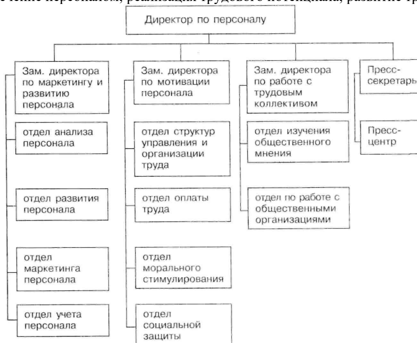
Рис. 1. Схема организационной структуры дирекции по персоналу

Служба управления персоналом комбината осуществляет свою деятельность по трем основным направлениям: обеспечение персоналом; реализация трудового потенциала; развитие трудового потенциала.